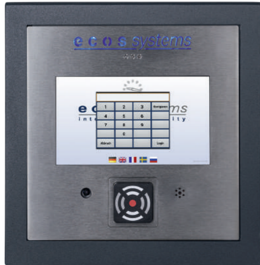
7" ecos Terminal, als Zutritts- und Gegensprechanlage mit RFID- oder Fingerprint-Leser